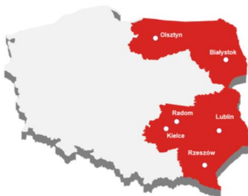
Rysunek 2 - schemat organizacyjny Dyrekcji PJ Strabag Sp. z o.o.

Nadto, na dowód zatrudniania przez Wykonawcę pracowników fizycznych wynagrodzeniem wyższym od minimalnego, STRABAG przedkłada poglądowo zanonimizowane umowy o pracę wraz z aneksami wybranych pracowników zatrudnionych na stanowiskach według poniższej tabeli, których zamierza w przypadku wyboru jego oferty skierować do realizacji przedmiotu Postępowania (Dowód 3–tajemnica przedsiębiorstwa).